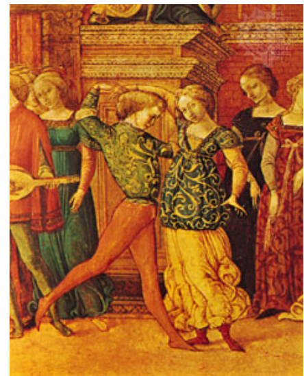
Renaissancetanz „Gaillarde“, Detail aus „Antiochus und Stratonice“ vom so genannten Meister der Stratonike, Siena, 15. Jahrhundert (heute in der Huntington Library, San Marino (Kalifornien))

Der Begriff Historischer Tanz ist parallel zu dem der Alten Musik entstanden. Wie man am Beginn des 20. Jahrhunderts begonnen hat, Alte Musik auf nachgebauten Instrumenten wieder aufzuführen, so hat man fast zeitgleich auch begonnen, alte Tänze nach den schriftlich überlieferten Zeugnissen nachzutanzten. Ein Großteil der überlieferten Tänze sind die Tänze der höheren Gesellschaftsschichten. Aus diesem Grund wird Historischer Tanz oft mit Höfischem Tanz gleichgesetzt. Es existieren jedoch auch zahlreiche Quellen, in denen die Tänze des Bürgertums aufgezeichnet sind (Branle, Kontratänze, Ecosaïse, Quadrille etc.). Der Begriff Historischer Tanz hat sich in Abgrenzung zum Volkstanz, dem Zeitgenössischen Tanz und dem klassischen Ballett als Oberbegriff für die europäische Tanzkunst des 15. bis 19. Jahrhunderts inzwischen fest etabliert.