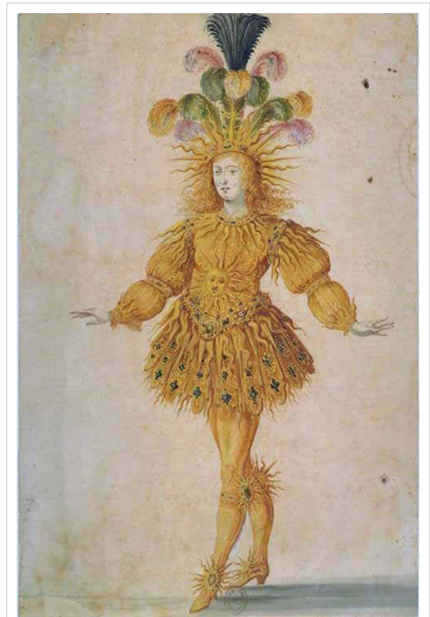
Der junge Louis XIV. in der Hauptrolle des Apollo im „Ballet royal de la nuit“ 1653

Ballettmeister wie Pierre Beauchamp, Jean Favier d. Ä. und Jean-Baptiste Lully, 1653 zum compositeur de la musique instrumentale de Roi ernannt, erlangten mit ihren Choreographien, die von zunehmend professionellen Tänzern ausgeführt wurden, großen Ruhm.